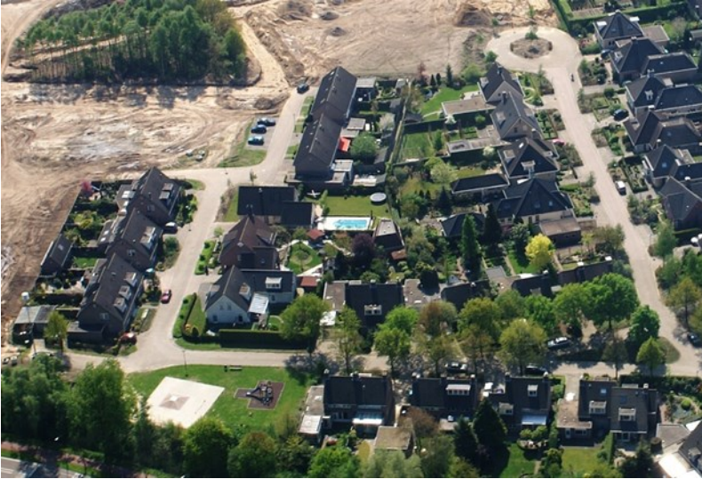
De Hofstad voor de uitbreiding.

De Hofstad zelf is later als uitbreiding gerealiseerd. Er werden ook een aantal woningen gerealiseerd voor Eeneindse starters en enkele woningen van Helpt Elkander. Lange tijd woonde men zeer rustig in de Hofstad daar is door de laatste uitbreiding wel enige verandering in gekomen.