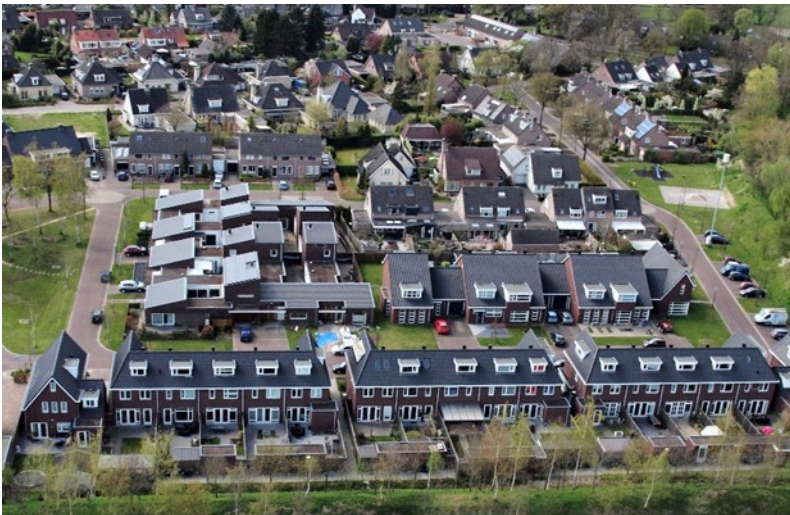
De uitbreiding bij de Hofstad